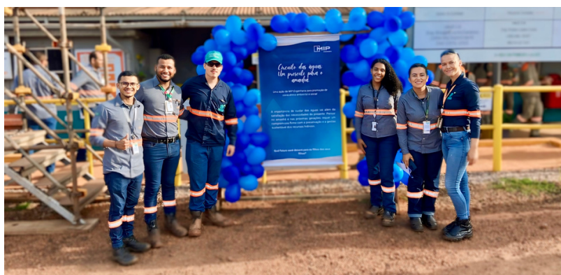
Circuito das Águas