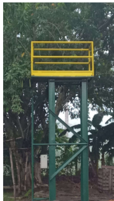
Estrutura para a EMEF José Cândido dos Santos.